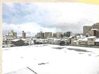
2022年1月、更地になり、同年春から建設が始まりました