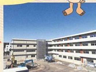
2023年11月、取り壊しから2年超、完成まであと少し