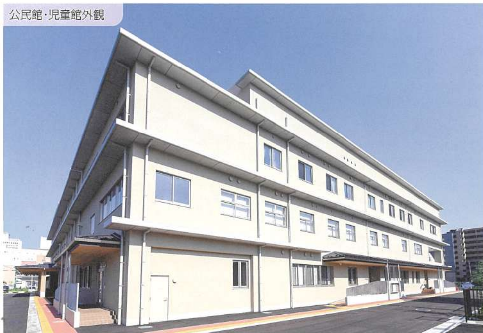
公民館・児童館外観

と思います。それは取りも直さず、近年、公民館活動にも求められてきている“SDGs”の考え方の本質であると思っております。 芳齋公民館が外観だけでなく、中身もしっかりと新しく生まれ変わったと感じていただけるよう、これからも活動してまいります。 今後とも皆さまの変わらぬご支援を賜りますよう、お願い申し上げます。