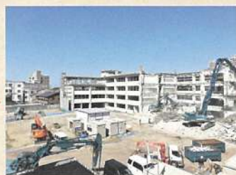
2021年10月、あっという間に校舎が、、、