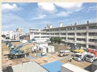
2021年8月、旧芳齋分校の取り壊し開始