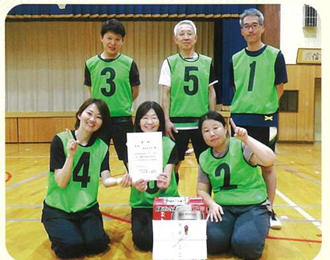
優勝 西町会Aチーム