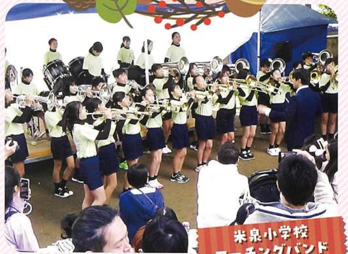
米泉小学校 マーチングバンド