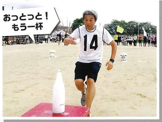
おっとつと! もう一杯