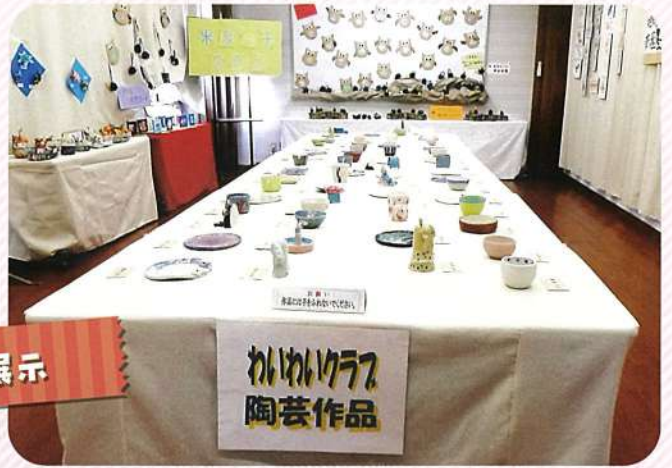
わいわい77 陶芸作品