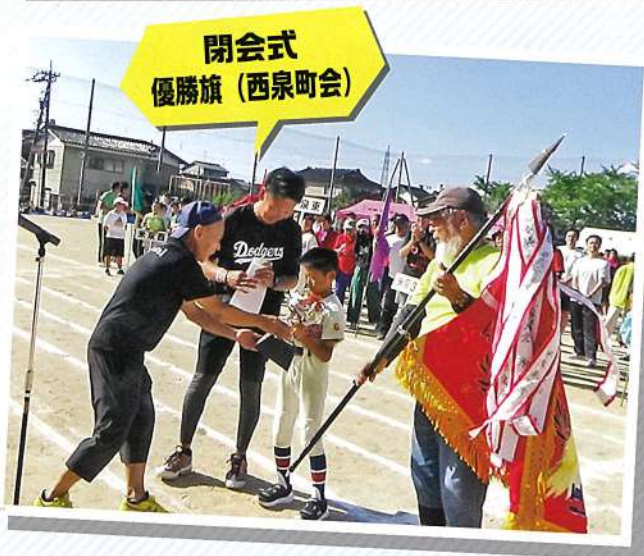
閉会式 優勝旗 (西泉町会)