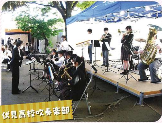
伏見高校吹奏楽部