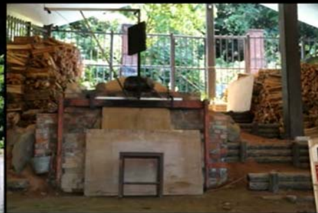
登窯の焚き口・窯は山側へ4連