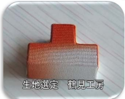
生地選定 鶴見工房